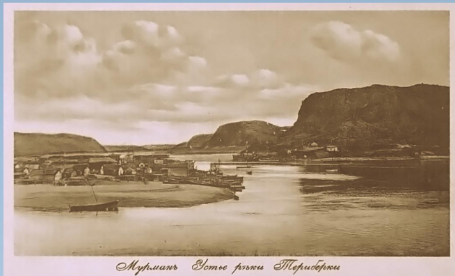
Мурманск. Восток фотки Териберки

Териберка упоминается в исторических документах с начала XVII века. На протяжении более чем двух веков она существовала в качестве сезонного становища, куда на время промысла приходили рыбаки.