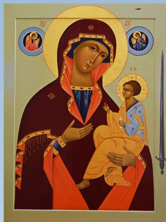
Современный список чудотворного Териберского образа Божией Матери «Грузинская»

С XIX века в Териберке существует часовня в честь особо почитаемого на Мурманском берегу чудотворного списка иконы Божией Матери «Грузинская», писанного на железном листе в 1754 году в Соловецком монастыре. Образ попал в Териберку после сожжения английскими моряками в 1809 году часовни Святителя Николая Чудотворца на Кильдине, где он ранее находился.