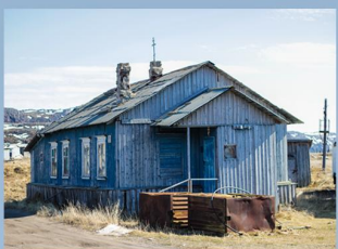
Храм Святого пророка Илии

С 1990-х годов в Териберке начинает возрождаться духовная жизнь. В исторической части Териберки под храм Святого пророка Божия Илии было приспособлено одноэтажное жилое здание (сейчас церковь не действует из-за аварийного состояния).