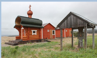
Часовня Святителя Николая и поклонный крест, выполненный по эскизу Р.С. Чебатуриной

Вблизи места, где ранее располагался храм Грузинской иконы Божией Матери был установлен поклонный крест, выполненный по эскизу заслуженного художника РФ Чебатуриной Р.С.