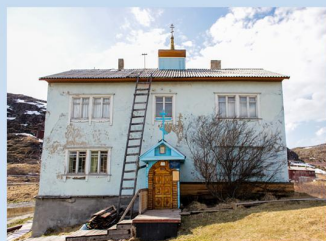
Храм Иконы Божией Матери «Тихвинская»