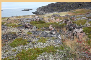
Место, где ранее располагалась часовня Святителя Николая Чудотворца (2017 год, Шельпино)

Осенью того же года было установлено место, где ранее располагалось древнейшее православное сооружение Восточного Мурмана – часовня Святителя Николая Чудотворца в Шельпино.