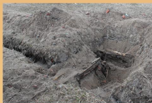
Фрагмент фундамента храма Грузинской иконы Божией Матери (2016 год, Териберка)

Православные сооружения (церкви и часовни) Русского берега, возведённые до 1917 года, за единственным исключением, к настоящему времени не сохранились. Здание храма Преображения Господня в Рынде – последнее уцелевшее церковное строение на востоке Мурмана, имеющее дореволюционную историю.