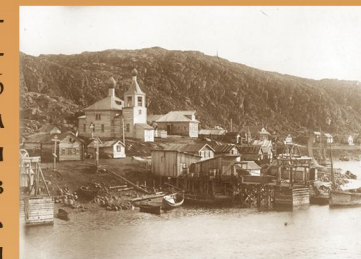
Рында. Вид на церковь Преображения Господня

В 1885 был построен вместо одноименной часовни, и в 1886 году освящен храм Грузинской иконы Божией Матери в Териберке . Церковь Святителя Николая Чудотворца в Гаврилово сооружается в 1888–1889 годах. Храм Святого пророка Божия Илии в Харловке возведен в 1892, освящен в 1894 году. Часовня Введения во храм Пресвятой Богородицы , с 1902 года существовавшая в Голицыно , в 1908 году была перестроена в одноименную церковь.