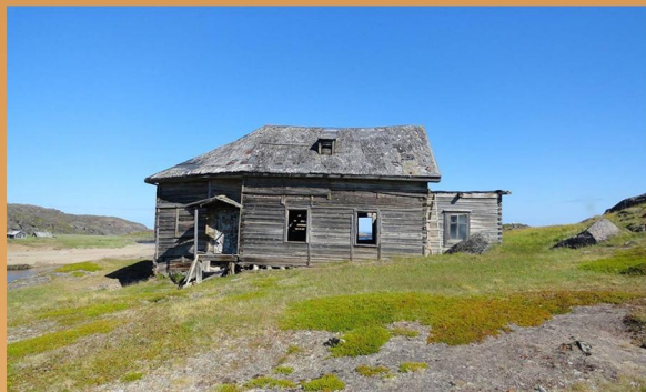
Церковь Преображения Господня (2016 год, Рында)

Православные сооружения (церкви и часовни) Русского берега, возведённые до 1917 года, за единственным исключением, к настоящему времени не сохранились. Здание храма Преображения Господня в Рынде – последнее уцелевшее церковное строение на востоке Мурмана, имеющее дореволюционную историю.